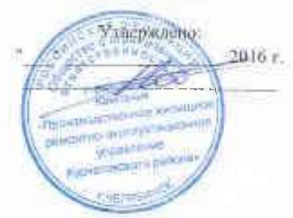
ГРАФИК Технического обслуживания внутридомовых газопроводов и газового оборудования на февраль 2016 года по ООО "ПЖРЭУ Курчатовского района"